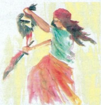
Giuditta con il capo reciso di Oloferne (Gdt 13,1-10). Illustrazione di Jerome Ypulong.

La presenza delle donne nel ministero di Gesù e la loro partecipazione alla sua missione è